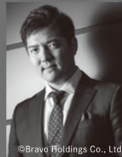
ファルケ博士 大西宇宙